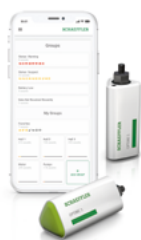
OPTIME Condition Monitoring Sensoren und App

Mit automatischen und intelligenten Schmierstoffgebern sorgen unsere Lösungen jederzeit für optimale Schmierung und machen manuelles Nachschmieren überflüssig.