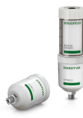
Intelligenter Schmierstoffgeber OPTIME C1 und automatische CONCEPT-Schmierstoffgeber